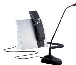
»LA-90 SET« Art.-Nr.: A-4211-0

»LA-90 SET« enthält das »LA-90«, ein Tischmikrofon, einen Handhörer und einen speziellen Halterungs-