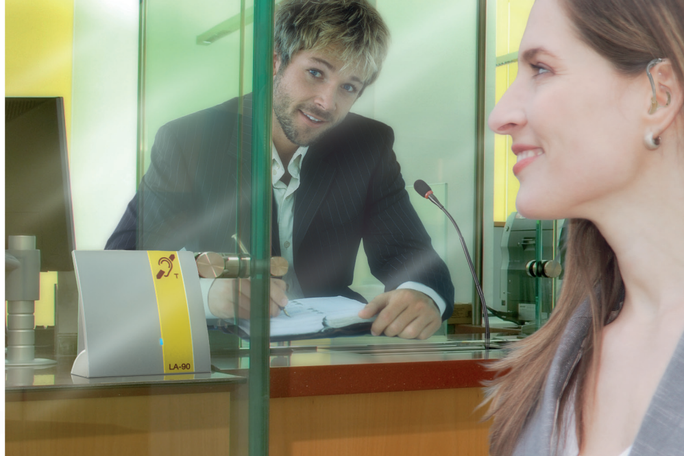
Induktiv hören via Hörgerät oder CI mit Telefonspule.

Das »LA-90« erlaubt es, ergänzend zum integrierten Mikrofon ein externes Mikrofon anzuschließen. Das erweitert die Flexibilität hinsichtlich der Positionierung zwischen Sprecher und Zuhörer erheblich.