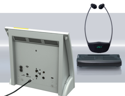
Der Ringschleifenempfänger LPU-1 DIR, Art.-Nr.: A-4276-0 (Abb. mit Ladestation, Art.-Nr.: A-4977-0), bietet klaren Empfang direkt am Ohr für Menschen mit verringertem Hörvermögen, die keine Hörgeräte tragen.

Ideal für Einsatzbereiche, in denen Diskretion bei der Beratung eine wichtige Rolle spielt. Dank des Handhörers können auch normalhörende Kunden von der dargebotenen Funktion profitieren.